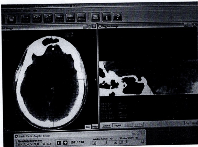
Figura 2. Tomografía posoperatoria inmediata de la paciente 1 operada por TOC. Se observa la zona de ablación en el cíngulo anterior rodeada de edema.